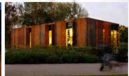
Der Pavillon Madeleine in Kayl: Neubau eines Restaurant-Pavillons im ebenfalls neu gestalteten Park Ouerbett.