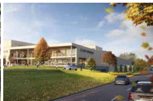
Herausragende Beispiele für urbane Gestaltung. Links: der „Place Paul Jomé“ in Hesperange; rechts: Erweiterung der Shopping Mall „City Concorde“ in Bertrange.

und die Erweiterung des Nells Park Hotels in Trier empfohlen. Hauptstadtbesucher treffen auf WW+ im kürzlich eröffneten Besucherzentrum „Gärten der Welt“ in Berlin-Marzahn. Für die Gestaltung dieses Tagungs-, Begegnungs- und Informationsortes „im Fluss der Natur“ überzeugte WW+ in einem internationalen Wettbewerb – und gewann den 1. Preis.