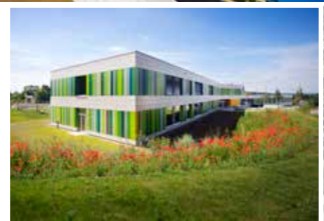
In Schouweiler baute WW+ eine Grundschule mit Kindertagesstätte.

In der Folgezeit sollte sich das Team in Luxemburg, aber auch in Deutschland einen Namen machen mit Projekten, die bereits im ersten Jahrzehnt eine große Bandbreite abdeckten: der Städtebau, die Gestaltung großer urbaner Flächen wie z. B. der Park Ouerbett in Kayl, die Neugestaltung des Stadtzentrums von Mondercange oder die Gestaltung öffentlicher Einrichtungen und Schulen – die Kinderkrippe in Dagstuhl z. B. der Neubau der Grundschule in Schouweiler sowie die Architektur einzelner Gebäude, sei es im öffentlichen oder im privaten Bereich. Höhepunkte in diesen ersten Jahren: die Teilnahme am Wettbewerb für die türkische Botschaft in Berlin, die Bank of China in Luxemburg und die Beauftragung für den Pavillon Madelaine, ein vielfach ausgezeichnetes Projekt, das WW+ erneut einen ganz erheblichen Zuwachs an Reputation bringt.