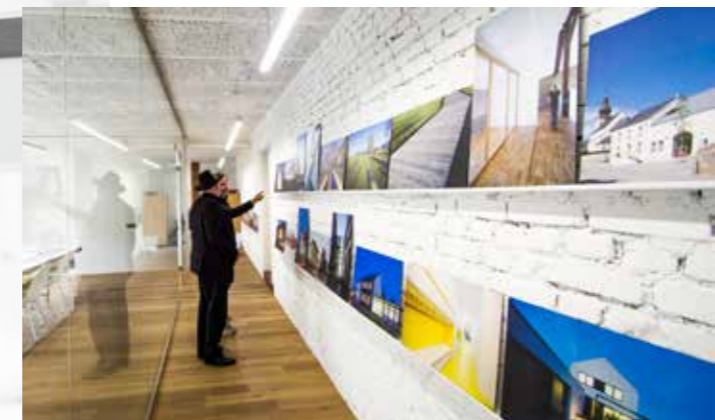
Ein Blick in die Räumlichkeiten von WW+, ein ehemaliges Lagerhaus.