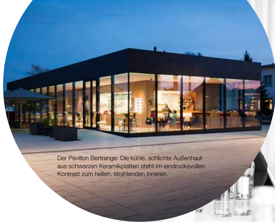
Der Pavillon Bertrange: Die kühle, schlichte Außenhaut aus schwarzen Keramikplatten steht im eindrucksvollen Kontrast zum hellen, strahlenden Inneren.