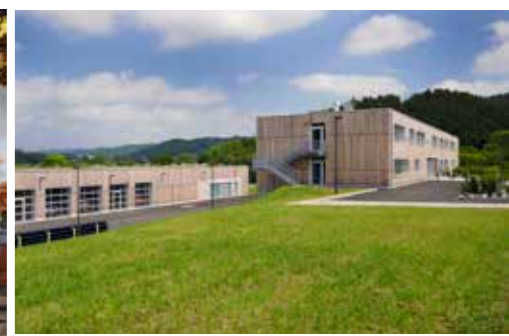
Ein Projekt in Niederprüm/Deutschland: Der Neubau des Betriebs- und Verwaltungsgebäudes als Hauptsitz der Kommunalen Netze Eifel (KNE).