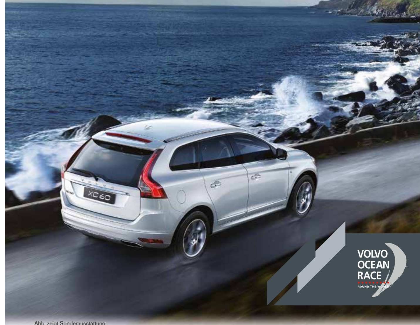
Abb. zeigt Sonderausstattung.

Die Volvo XC60 Ocean Race Edition ist mit ihren Designelementen eine Hommage an die anspruchsvollste Hochseeregatta der Welt. Freuen Sie sich z. B. über die eleganten 18"-Portunus-Leichtmetallfelgen, die einzigartigen Ocean Race Dekoreinlagen oder das Volvo Ocean Race Emblem am Kotflügel. Und genießen Sie die schöne Lederpolsterung, wenn Sie die Herausforderungen Ihres Alltags meistern. Kommen Sie vorbei zu einer Probefahrt. Wir freuen uns auf Sie.