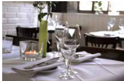
Neues Schlemmerparadies – für Sie entdeckt.

hubor17: Damit fängt das neue Jahr gut an! Rückschau: Die Highlights vom Tag der Lichter bei Hubor & Hubor. Vorschau: Designtrends – das Beste von der imm cologne Durchblick: Die besten Ideen für traumhaft schönes Wohnen. Ausblick: 24 Seiten Genuss, Wohnkultur und Vorfreude auf den Frühling.