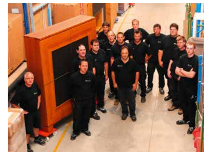
Auch in punkto Nachhaltigkeit ein Team: Umweltschutz ist wichtig!