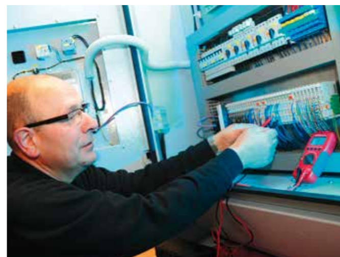
Fortschritt der Umwelt zuliebe braucht Technik.

Klimaanlage installiert, die auf Basis der Wärmerückgewinnung auch als Heizsystem – ganz ohne fossile Brennstoffe – funktioniert. Seit 2011 pflegen wir beste Kontakte zum Himmel. Zwei Photovoltaikanlagen, auf dem Dach unserer Red Box und auf dem Dach unseres Lagers, tun den ganzen Tag nichts anderes, als eifrig die unübertroffene Energie der Sonnenstrahlen einzufangen. Für uns heißt das Strom für Werkstatt und Klimaanlage. Somit eine kostengünstige und emissionsfreie Versorgung mit Elektrizität. Bei so viel Effizienz geraten wir gerne mal ins Schwärmen und Anlass zum Träumen gibt es auch. Die Einrichtung einer Elektrotankstelle z. B. und damit verbunden – natürlich! – der Einsatz von noch mehr Stromautos. Ein derzeit anderes Experimentierfeld ist die sinnvolle thermische Verwertung unserer Holzabfälle. Ja, wir geben es gerne zu: Nachhaltigkeit ist für uns auch mit ganz schön viel Neugier, Lust und Entdeckerlaune verbunden und diese drei Zutaten – das wissen Sie – gehören zu unserem Lebenselixier.