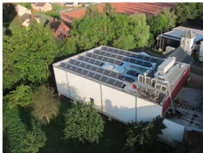
Die Photovoltaikanlage auf dem Dach unserer Red Box.