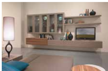
Design muss inspirieren!