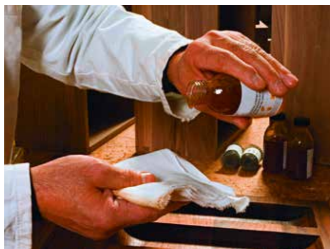
Ökologisches Finish: feinste Öle.

Ein Balance-Akt also, der, wie immer bei Kunststücken dieser Art, mit Umsicht, Weitsicht und gesundem Menschenverstand ausgeführt werden will. Dass wir uns bei Hubor & Hubor seit vielen Jahren genau darum bemühen, das glauben Sie uns hoffentlich aufs Wort!