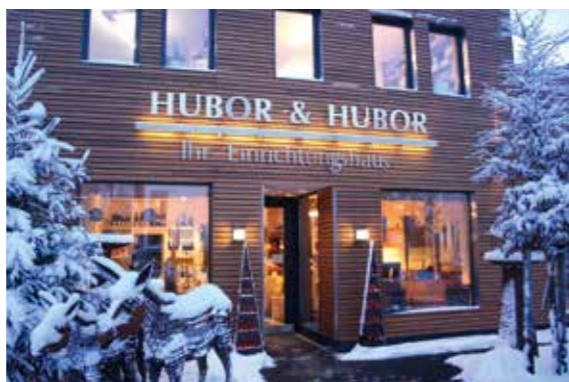
Freuen Sie sich drauf: Weihnachtsausstellung am 2. und 3. Advent. Einladung folgt!