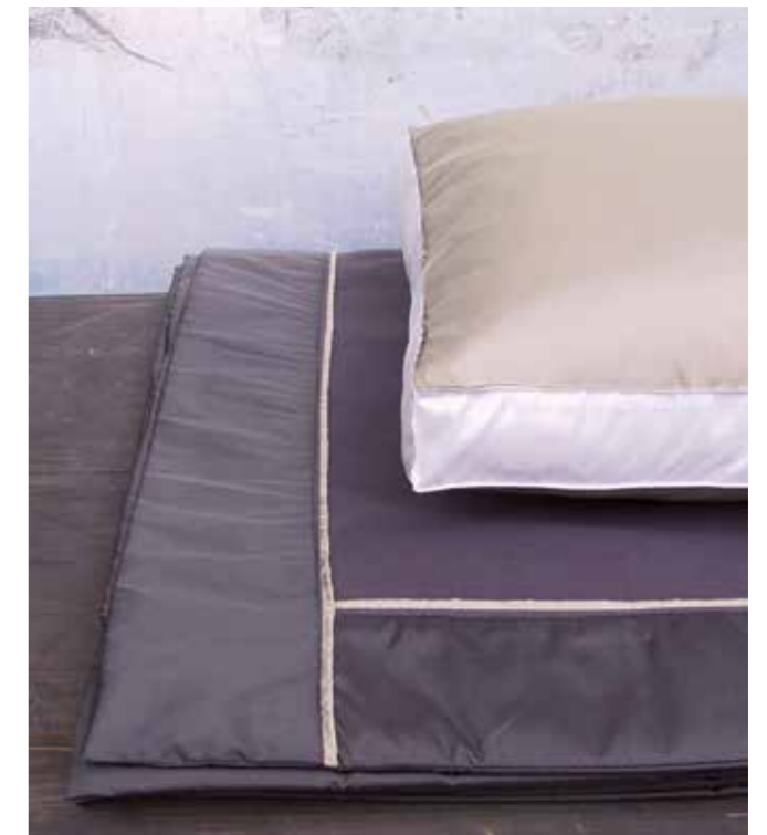
So sinnlich wie schön: Seide auf der Haut.