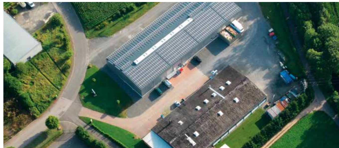
Strom von oben: Auf so viel Fläche kommt viel Sonne unter.

Als modernes Unternehmen gilt es heute mehr denn je, zwei Aspekte verantwortungsvollen Handelns in Einklang zu bringen. So, wie Nachhaltigkeit zum grünen Stichwort der Moderne, zum Gradmesser für Integrität und damit auch für die Reputation eines Unternehmens geworden ist, so dürfen auch wirtschaftliche Notwendigkeiten und Belange nicht aus den Augen verloren werden.