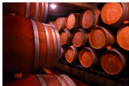
Edle Tropfen für die beste Zeit des Tages.