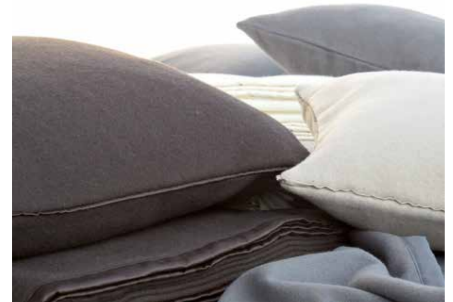
Hochwertige Baumwolle schmeichelt auch dem Auge.

Edle Baumwolle, fließender Satin, duftig, weich, zart und sanft ... das Design zurückhaltend elegant, verspielt romantisch oder fröhlich trendy? Das Spiel der Sinne beginnt bereits dort, wo Auge und Haut sich auf Verwöihnsmomente freuen, wo der Körper das Gefühl kuscheliger Geborgenheit erahnt. Der Stoff, aus dem die Bettwäsche Ihrer Träume ist – wir haben ihn! Denn selbstverständlich wissen auch wir, wie man das Glück über Nacht einlädt. Möglichkeiten dazu gibt es viele ... Am besten schauen Sie vorbei, kommen zum Sehen, zum Fühlen und zum Spüren, denn womit Sie auf Tuchfühlung gehen möchten, das ist immerhin eine ziemlich private Angelegenheit!