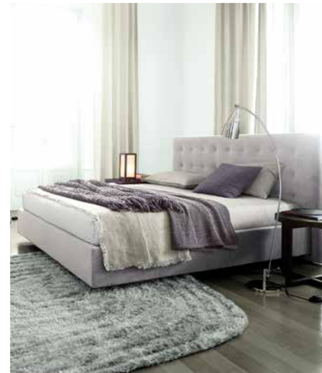
Guter Schlaf – guter Tag!