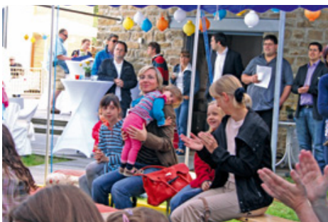
Sommerfest am Samstag, 30. Juni und Sonntag*, 1. Juli 2012. Freuen Sie sich. Bald ist es wieder so weit.