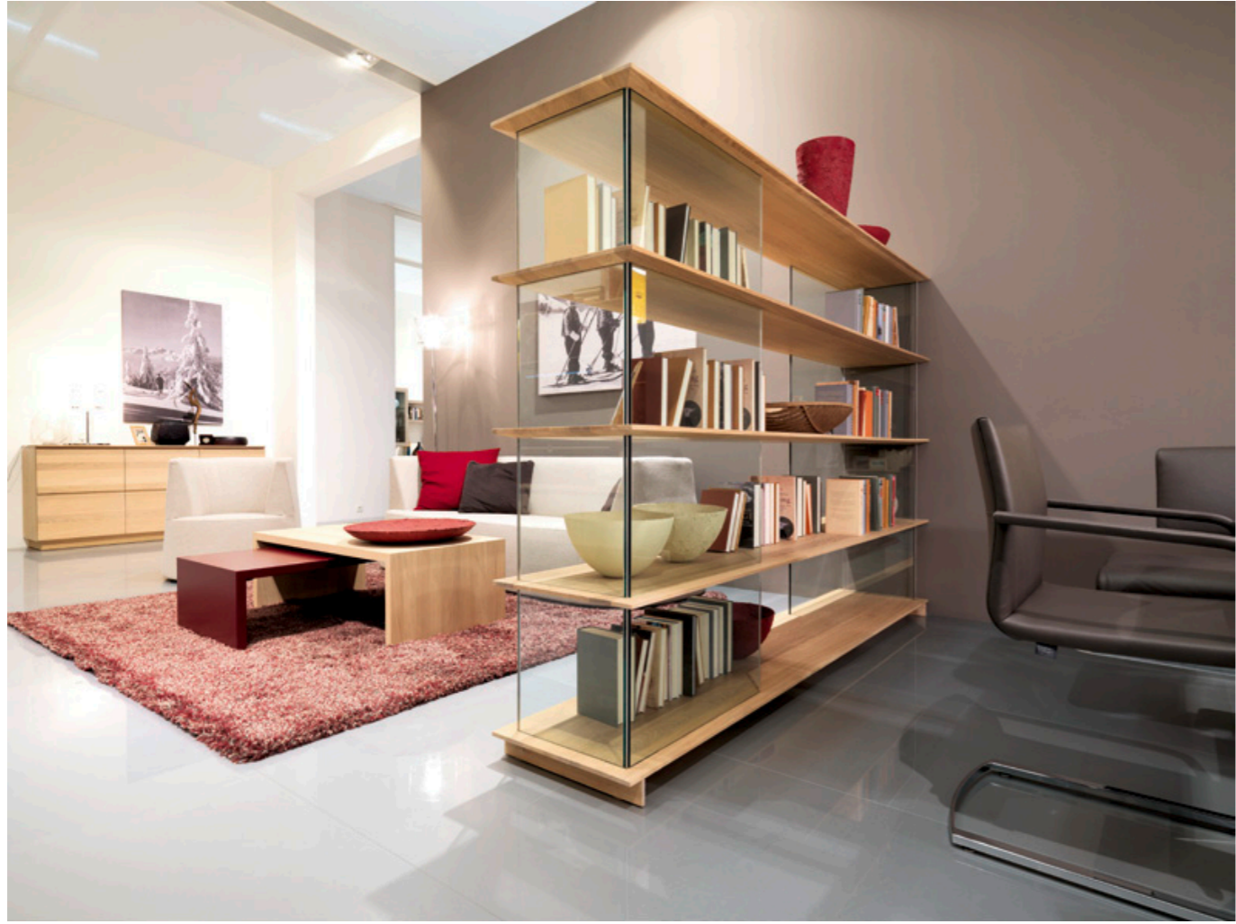
Massivholz gibt es bei uns in allen Arten und Ausführungen.