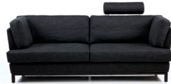
Design Roland Meyer-Brühl