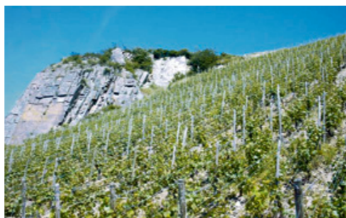
Ob edler Begleiter oder der Soloauftritt: Ein guter Tropfen ist immer ein Genuss.

Sie werden uns gut finden: Gute Fahrt zu Hubor & Hubor!