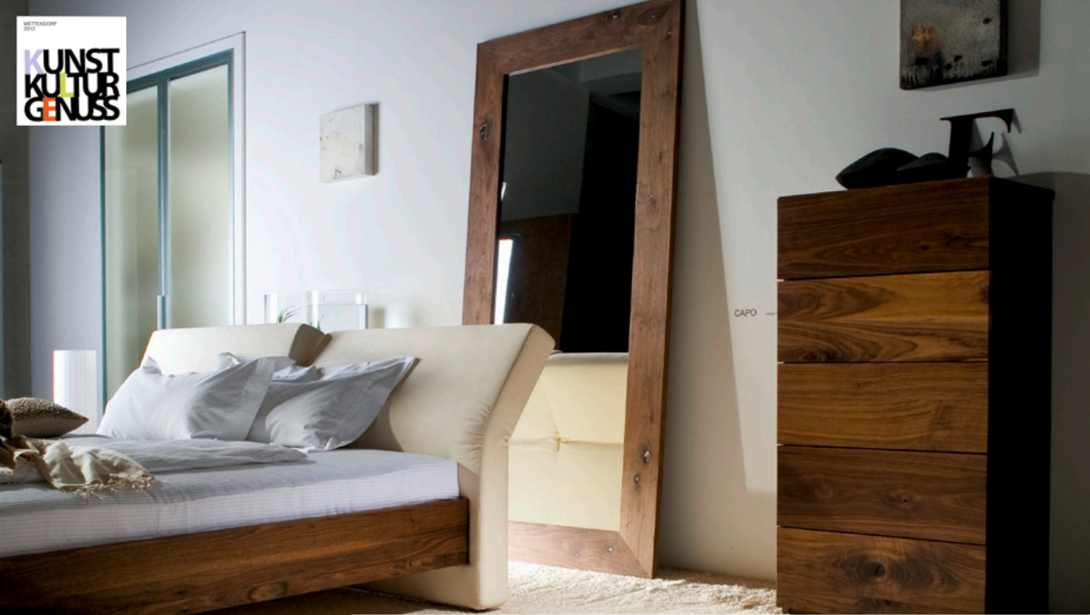
Bett Corso Individuelle Massivholz-Betten aus Oberfranken