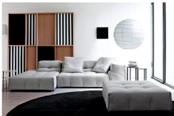
Entdecken Sie unser Wohlfühlprogramm.