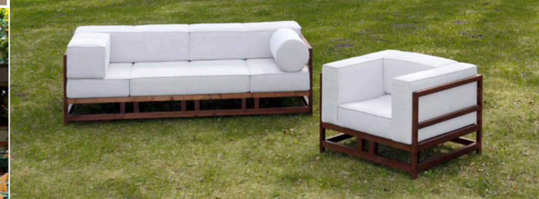
Schöne Polstermöbel aus dem Fränkischen.

Öffnungszeiten Frühlingsfest*: Samstag + Sonntag 10.00 - 18.00 Uhr *Beratung und Verkauf nur während der gesetzlichen Öffnungszeiten.