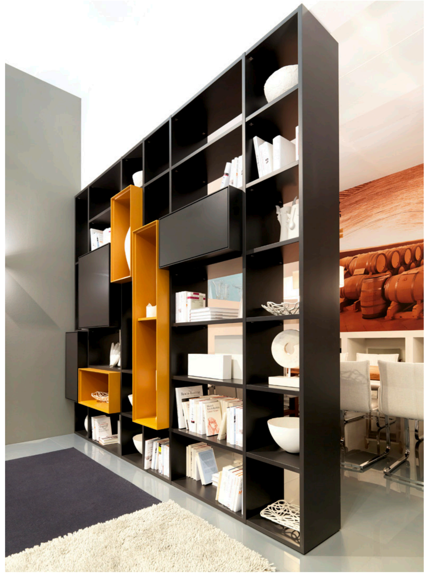
Farben, Lacke, Oberflächen, wir haben, was Ihr Herz begehrt!